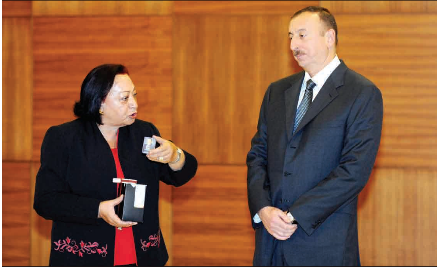
(əvvəli 2-ci səhifədə)

radılacaqdır. Onlardan 149-u standart, 13-ü suit, 2-si isə dupeks suit nömrədir. Burada müxtəlif restoran, kafe və barlar fəaliyyət göstərəcəkdir. Oteldəki 112, 65, 52 və 45 nəfərlik restoran və kafelerde qonaqlara keyfiyyətli xidmət göstərilməsi üçün hər cür şərait yaradılacaqdır. Burada 130 nəfərlik konfrans zalı da qurulur. Otele biznes mərkəzi,